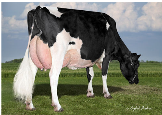
COOKIECUTTER MOG HANKER