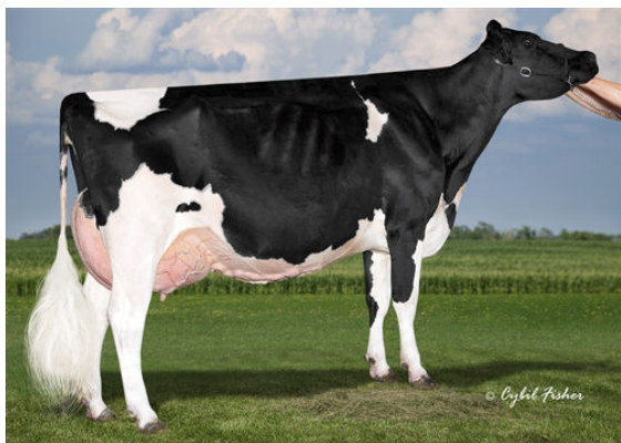
COOKIECUTTER MOG HANKER